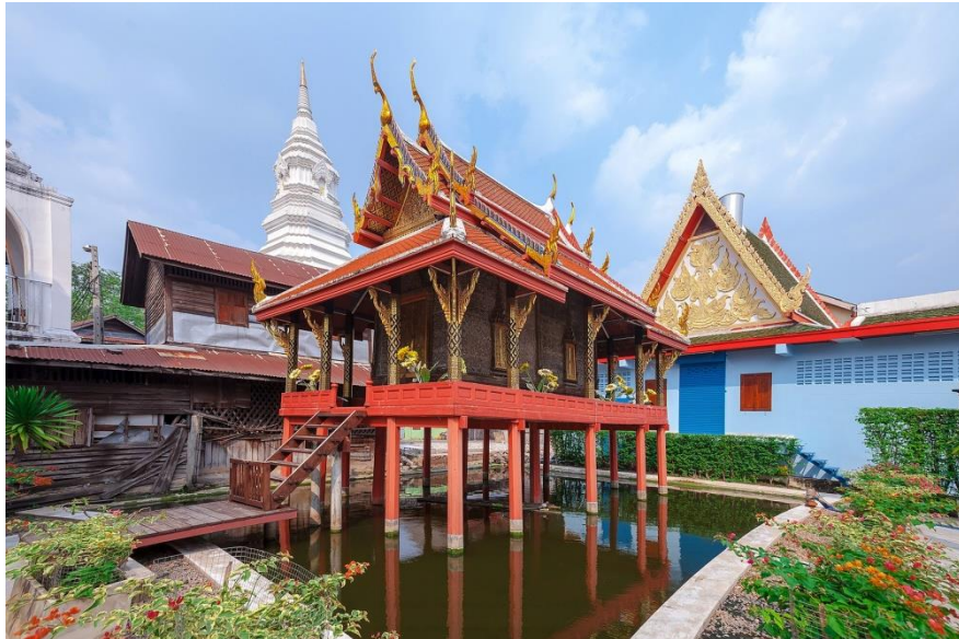
หอพระไตรปิฎก เป็นศิลปะสมัยกรุงศรีอยุธยาตั้งอยู่กลางน้ำ