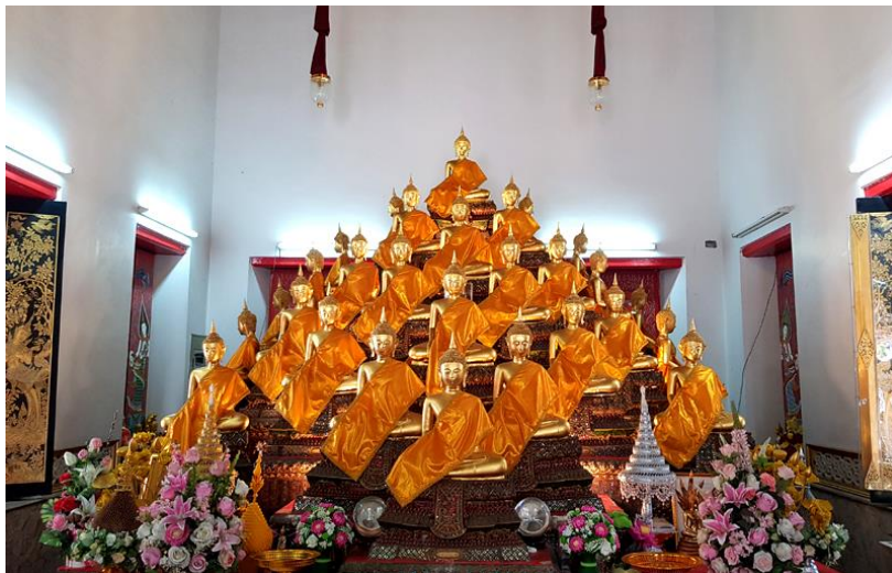
พระประธานในพระอุโบสถ พระพุทธรูปปางมารวิชัย จำนวน 28 องค์