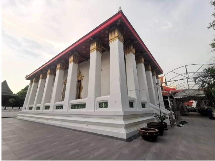
พระวิหาร