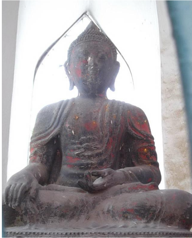
หลวงพ่อสมอ พระพุทธรูปปางฉันทสมอเป็นพระพุทธรูปที่มีลักษณะแบบจีนพระหัตถ์ซ้ายถือผลสมอเป็นพระพุทธรูปที่งดงามเป็นสง่า