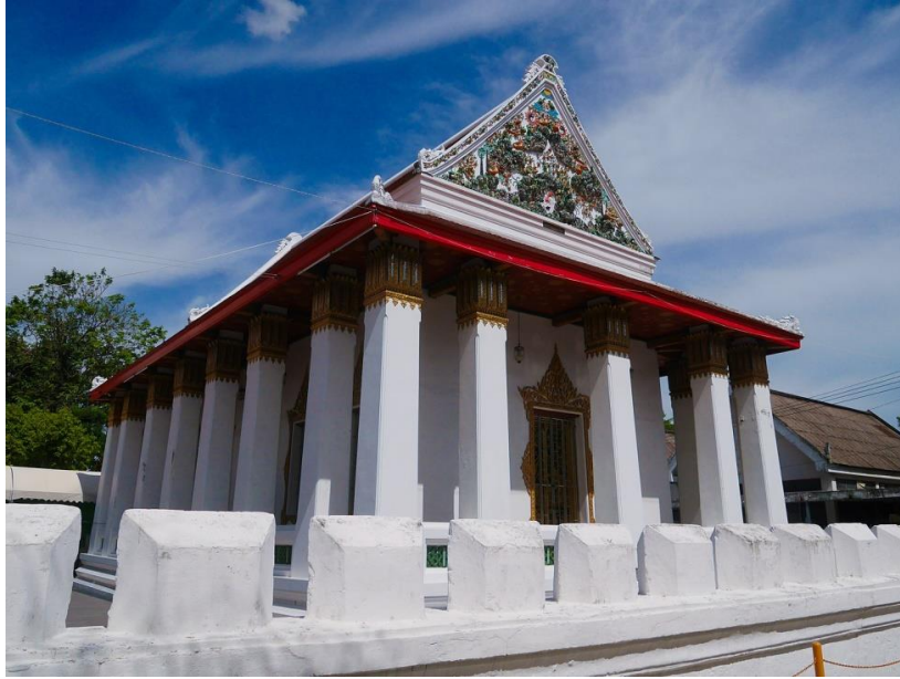
พระอุโบสถและพระวิหารยังคงเดิมตามศิลปะจีนหลังได้รับการปฏิสังขรณ์ โดยเลียนแบบวัดราชโอรสารามราชวรวิหาร